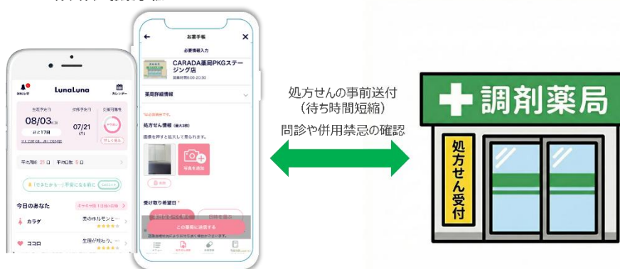
ルナルナ お薬手帳

近年、国民一人ひとりの健康増進と、より安全かつ効果的な薬物療法の実現を目指す「データヘルス改革」の一環として「電子お薬手帳」の導入が推進されています。 *3 このような中で、地域医療と、女性が日常的に利用するヘルスケアアプリが連携することで、より個別化された健康管理や健康相談につながる新たな薬局体験の提供を目指し、この度、全国 760 店舗以上の調剤薬局を展開し、ホスピタリティと DX で身近な医療を支えるプロフェッショナル集団としての役割を果たす日本調剤グループの調剤薬局 150 店舗にて「ルナルナ お薬手帳」の提供を開始します。